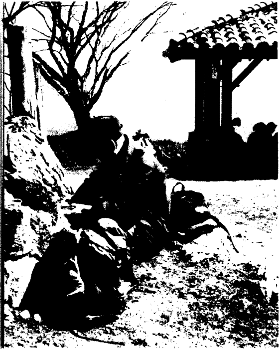
展望のいい日ノ出山山頂

山頂での休憩はゆつくりとりたい。何しろ展望がすばらしいのだ。とても標高902メートルとは思えないほど。吹き抜け