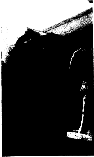
標高929メートル地点にある御嶽神社

晴れた日は都心の高層ビルや上越の山々まで見渡せる日ノ出山と、信仰登山で知られる御岳山。この二つを巡るルートはパリエーションが豊富だし、場合によってはケーブルカーを利用して、時間短縮、体力温存も考