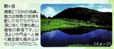
駒ヶ岳 標高2,133mの名峰。魅力は無数の池を配したなだらかな山頂に咲く、可憐な高山植物の群落です。山頂より中門岳へと続く縦走路を組み込んだコースのひとつ。