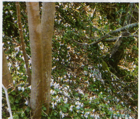
春の横根山の樹林帯は斜面も登山道もイワウチワの絨毯に

公園前から遊歩道に入り花貫川に沿って、伝説のある名馬里ヶ淵を眺めながら旧道に入る。国道の合流点の左に登山口の道標があり、アカマツの林を登るとススキリした尾根道になる。コブを2つほど過ぎ、登り返すと三等三角点のある都室山に着く。この先10分ほどで名馬里ヶ淵の分岐になる。