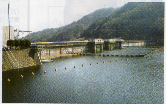
この花貫ダムからは太平洋が見える

わが茨城県には高い山がない。高鈴山は県内唯一花の百名山に名を連ねているが、身近な里山にも百名山に匹敵する山がある。県北部にある横根山は、標高はわずか389mであるが、4月上旬はイワウチワの素晴らしい群生地となる。