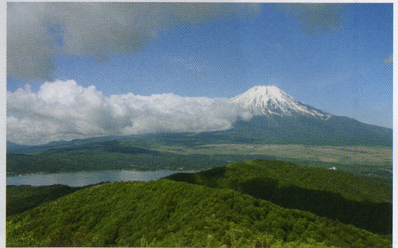
山頂に着くとみごとに富士山の眺望が待っていた

登山道や山頂にあるいは予期せぬ場所で大きな石に出合う。自然のなせるワザ、偶然あるいは神のいたずら?か、その不思議に驚く。富士山の北東、山中湖畔に近い標高1413mの石割山、その8合目には石割神社が鎮座し、古事記(712年)に「天の岩戸」伝説の地と伝承される神域がある。